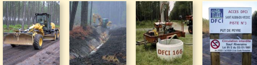
Pistes et ponts Fossés Points d'alimentation en eau Panneaux

Depuis 1945, elles aménagent la forêt en pistes, fossés, points d'alimentation en eau, ponts :