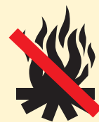
Feu de camps