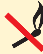
Allumer un feu